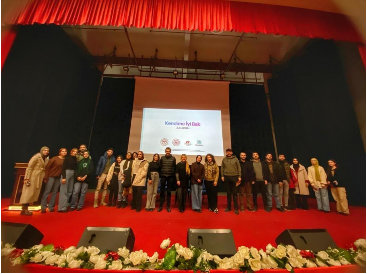
Kariyer Günleri Etkinliği